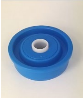
KTR .02 staal / .03 RVS