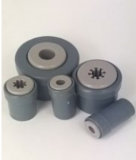
KTR .00 staal / .01 RVS