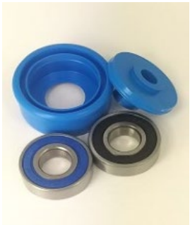
KTR .40 staal / .40S RVS