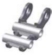
Type A - bus

A-kwaliteit | simplex type A 08B1 t/m 12B1 - simplex type B 08B1 t/m 16B1