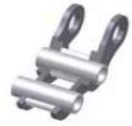
Type B - rol

Ketting geproduceerd door een ISO 9001 - ISO 14001 & API 7F gecertificeerd bedrijf.